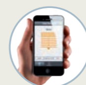
Motorisations, commandes et automatismes pages 12 et 13